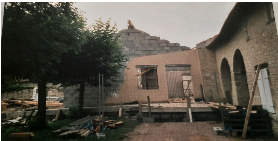
La construction de l'actuelle salle des fêtes