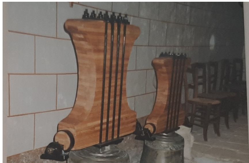
Les deux cloches, Marie et Florence, en attente sur le sol de l'église