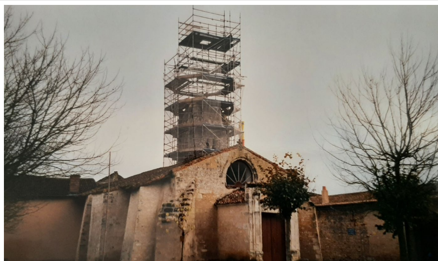
Construction du nouveau clocher et assemblage de la structure